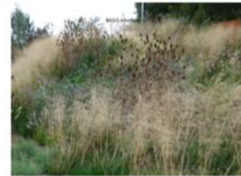
Rijke beplanting in alle seizoenen