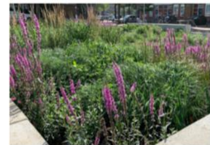
biologische waterzuivering in het Hofbogenpark