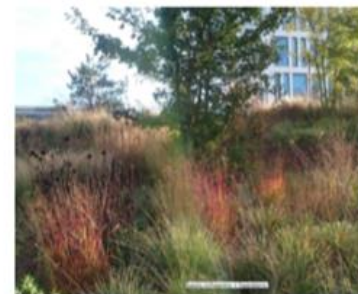
beplanting met geur en kleur