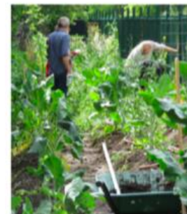
collectieve schooltuin + waterspel