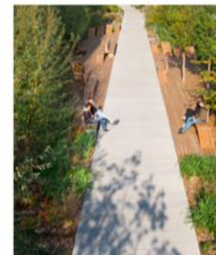
wandelen op hoogte