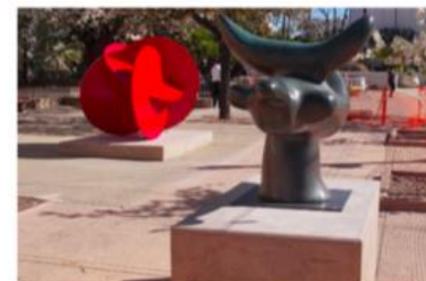
flex perrons _ expositie