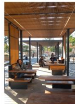
werk- en studie perrons